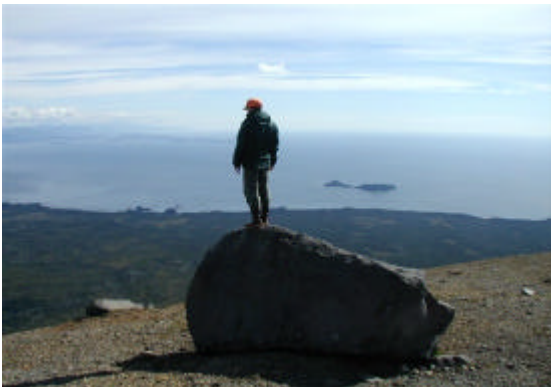
Barth - Mt Edgecombe - Alaska