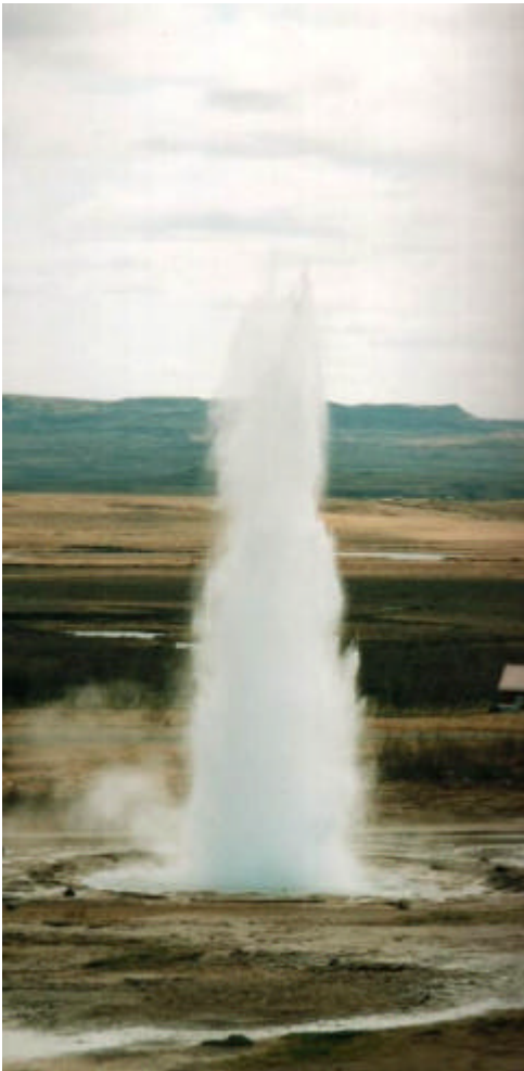
Geysir – magnifique nature !