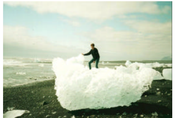
Aleth - Jokulsarlon - Islande